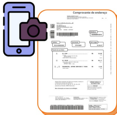
Imagem 4 - Foto do comprovante de endereço atualizado

3º passo: Tire uma foto do comprovante de endereço atualizado;