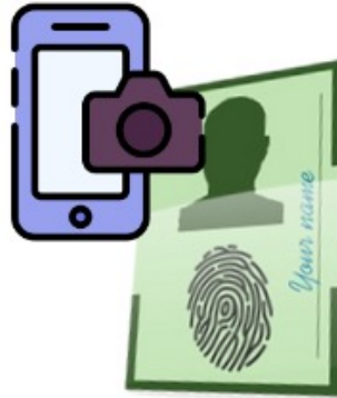
Imagem 3 - Foto do RG (frente e verso) ou CNH

2º passo: Tire uma foto do Rg (frente e verso) ou da CNH;